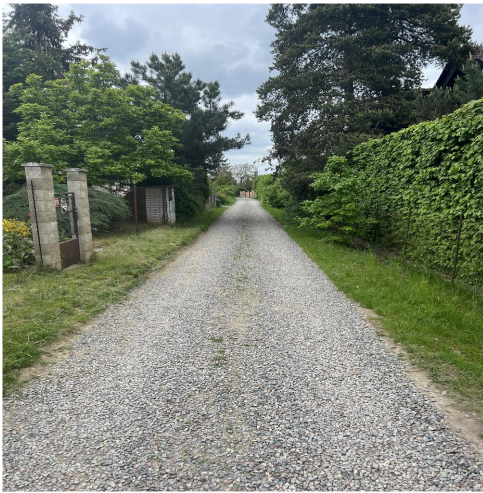
Inženýrské sítě – Ulice Nad Slunečnou, Lety